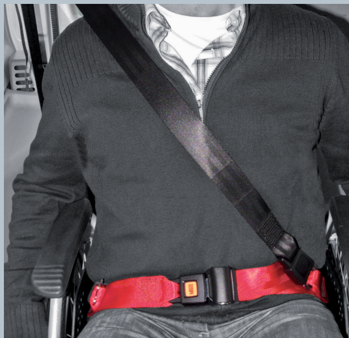
Der Beckengurt (rot) ist fester Bestandteil des Kraftknotens. Der Schulterschräggurt (schwarz) ist im KMP/Kfz montiert.

Der vorliegende AMF-Bruns Kraftknotenadapter ist in Anlehnung an DIN 75078-2 / ISO 10542 getestet. Der Rollstuhltest nach ISO 7176-19 obliegt dem Rollstuhlhersteller.