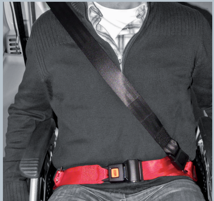
Der Beckengurt (rot) ist fester Bestandteil des Kraftknoten. Der Schultersträggurt (schwarz) ist im KMP/Kfz montiert.

Der vorliegende AMF-Bruns Kraftknotenadapter ist in Anlehnung an DIN 75078-2 / ISO 10542 getestet. Der Rollstuhltest nach ISO 7176-19 obliegt dem Rollstuhlhersteller.