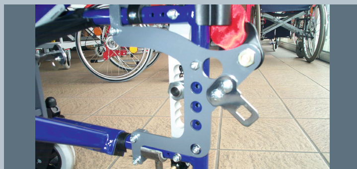
Zwei hintere Kraftknotensysteme mit jeweils einer genormten Schwerlastöse für Spannretractor. Der Beckengurt ist bereits fest montiert.